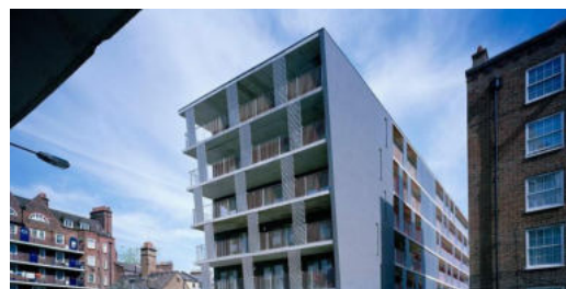
Рисунки 4. Anthony House. Fraser Brown MacKenna Architects. Лондон

В скандинавских странах правительство подходит к вопросу социального жилья другими способами. Финляндия – путем проведения национальных конкурсов. Примером может служить конкурс на проект и строительство социального жилья в городе Порвоо, по условиям которого нужно было построить жилье базовой комплектации. Цель проекта – предоставить нуждающимся муниципальные дома, архитектурно более привлекательные, чем в существующие выполненные по индивидуальным проектам. В последствие это позволит людям, проживающим в этом комплексе, обрести психологическую и эмоциональную стабильность, так как повысит их социальный статус и даст использовать дом как начало нового этапа в жизни (Рис.5) [3].