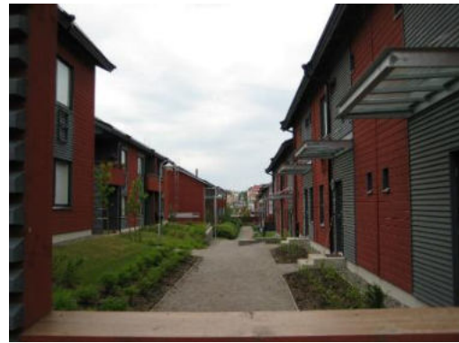
Рисунки 5. Доступное жилье в Порвoo, Финляндия.

История социального жилья в Казахстане, неразрывно связана с индустриальным домостроением СССР, и соответственно с попытками преодолеть главный побочный эффект типового строительства: производство безликой и некомфортной среды.