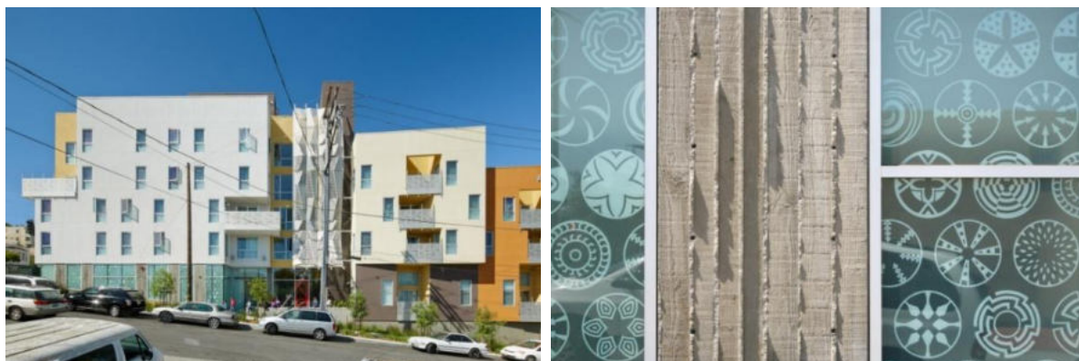
Рисунки 1. Жилой комплекс Bayview Hill Garden David Baker & Associates.

Один из его проектов располагается в исторически афроамериканском районе, и в знак уважения сообществу при проектировании архитекторы добавили «афроцентричные» мотивы. Характерный набор из цветов, символов и орнаментов, которые создают особый дух места. Такой подход позволил приблизить жильцов к истории района и создать уникальный проект (Рис.1).