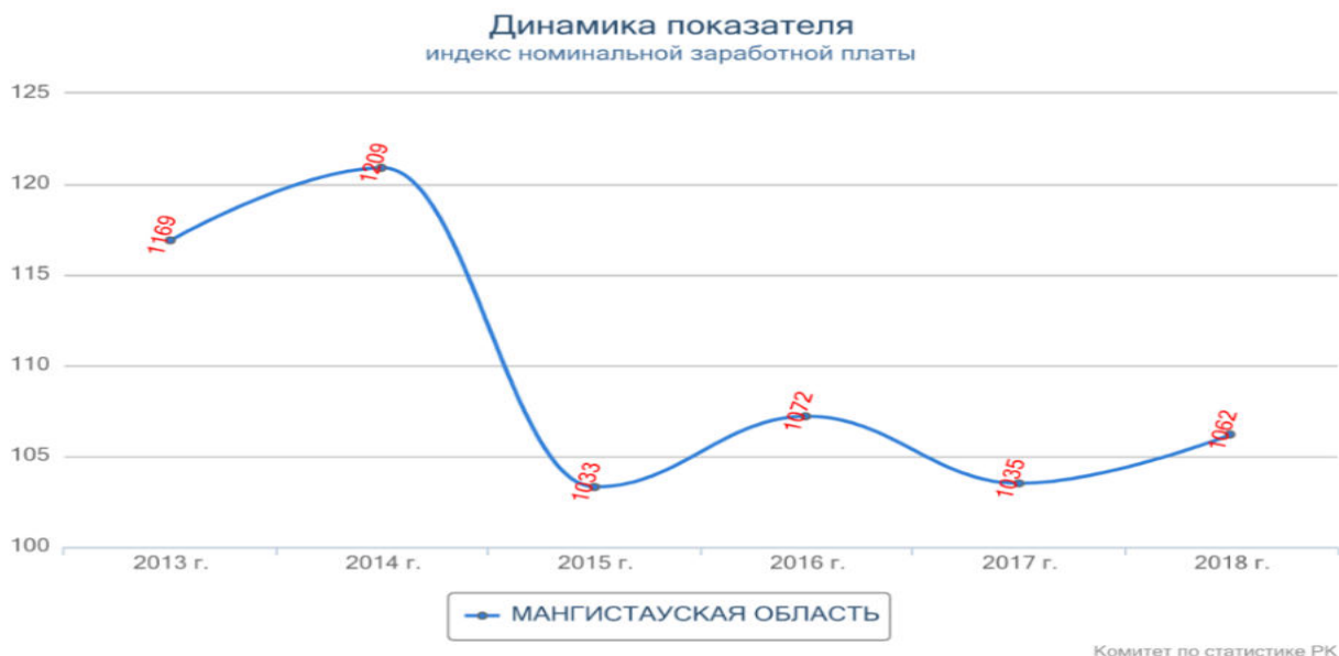
Рисунок 3 – Индекс номинальной заработной платы в Мангистауской области Примечание: составлено авторами на основании [1]

Зарботная плата падает с огромной скоростью. С 2014 года по 2018 она упала в два раза. Это не может не сказаться на экономическом потенциале малого бизнеса, который наиболее чувствителен к таким перепадам, нежели крупный бизнес, у которого обычно есть хоть какая-то подушка безопасности. Можно предсказать, что если заработная плата не начнет подниматься, то и активного роста в экономике ждать не стоит.