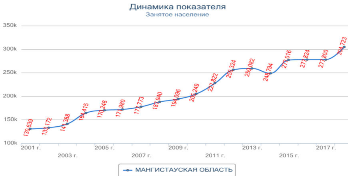
Рисунок 2 – Занятое население в малых предприятиях в Мангистауской области Примечание: составлено авторами на основании [1]

Показатель занятости демонстрирует очень хорошую динамику. За последние семь лет он вырос в два раза. Однако это пока что ни о чем не говорит нам. Для этого мы должны посмотреть на другие показатели, например на заработную плату на графике ниже.