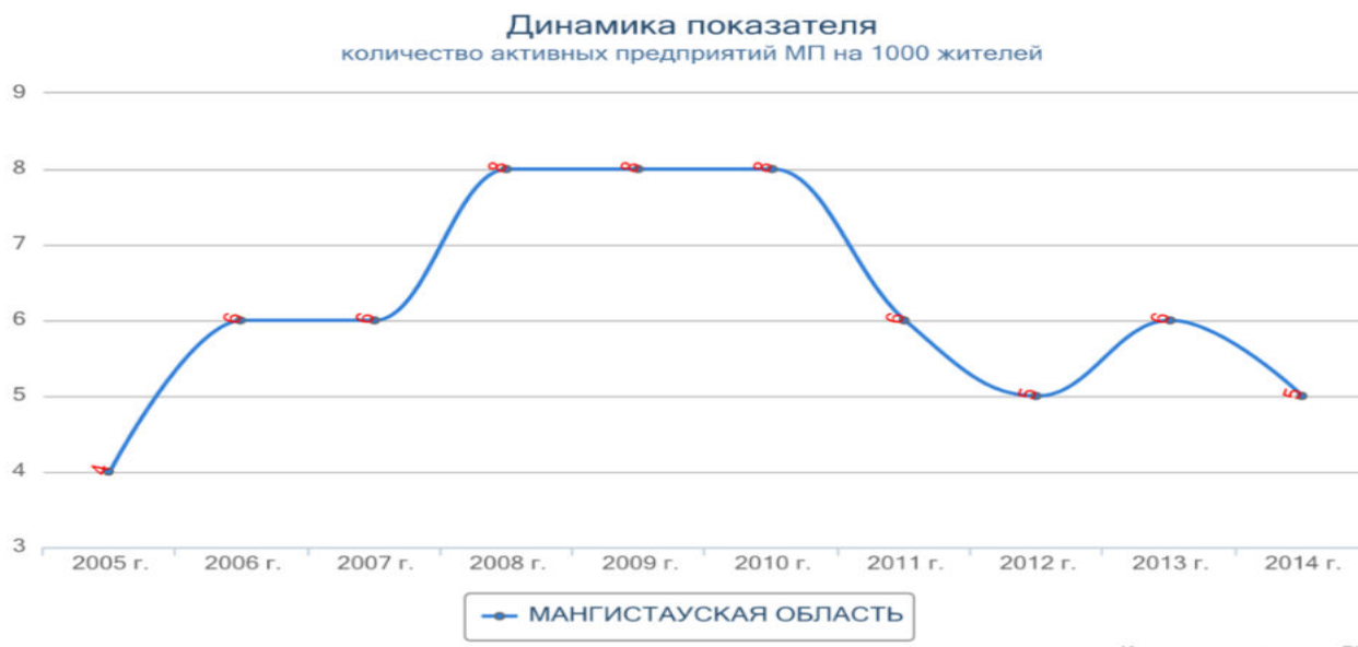
Рисунок 5 – Динамика активных предприятий на 1000 жителей в Мангистауской области

Примечание: составлено авторами на основании [2]