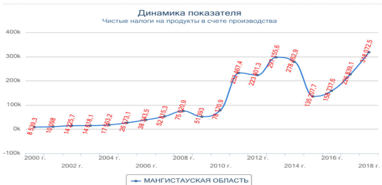
Рисунок 4 – Чистые налоги в счете производства. Примечание: составлено авторами на основании [2]

Зарботная плата падает с огромной скоростью. С 2014 года по 2018 она упала в два раза. Это не может не сказаться на экономическом потенциале малого бизнеса, который наиболее чувствителен к таким перепадам, нежели крупный бизнес, у которого обычно есть хоть какая-то подушка безопасности. Можно предсказать, что если заработная плата не начнет подниматься, то и активного роста в экономике ждать не стоит.