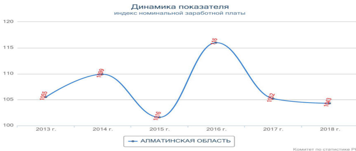
Рисунок 4 - Индекс номинальной заработной платы, в % Примечание- составлено автором на основании [3].

Малый бизнес занимает важное место экономической деятельности страны. Ведь именно эта деятельность влияет на рост экономики и на развитие научно- технического прогресса, а также помогает с решением социальных проблем государства. В заключении можно сделать вывод, что малые предприятия являются мощным регулятором экономики. Ведь малый бизнес в рыночной экономике – это ведущий сектор, определяющий темпы экономического роста, состояние занятости населения, структуру и качество внутреннего национального продукта (ВНП), формирующий конкурентную среду, а также оперативного реагирующий на изменение конъюнктуры рынка.