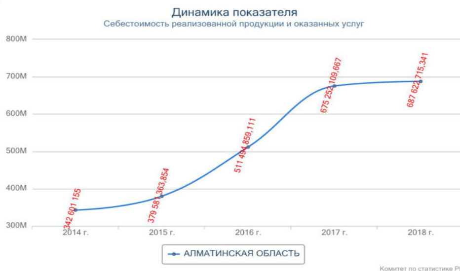
Рисунок 3 - Себестоимость реализованной продукции и оказанных услуг, в тыс. тг Примечание- составлено автором на основании [3].

Малое и среднее предпринимательство является одной из движущих сил экономического и научно-технического прогресса, и основным поставщиком рабочих мест во всех отраслях экономики. Уровень малого и среднего бизнеса и активности предпринимателей во многом определяет уровень демократизации страны и открытости ее экономики. Сейчас ниже я хочу показать внешние и внутренние факторы, воздействующие на экономический потенциал малого бизнеса.