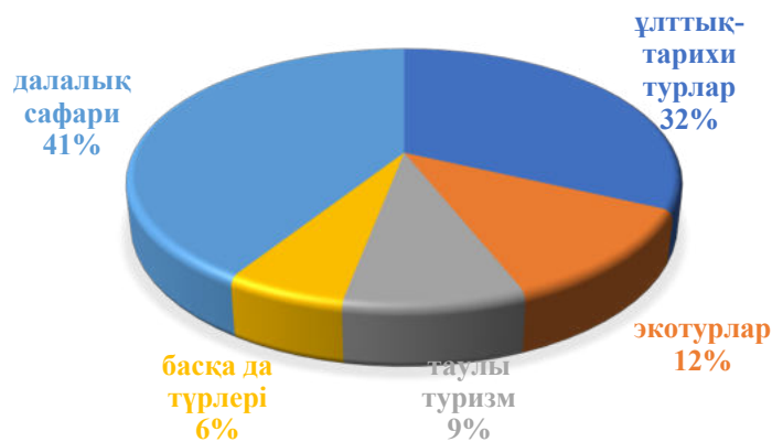
2 - сурет. Шетел туристерінің Қазақстандағы туризм түрлеріне қызығушылығы

«ИПК» маркетингтік зерттеулері нәтижесінде шетел туристерінің сұраныстары бойынша далалық сафариде, дәлірек айтқанда, далалықта джиппен саяхатты қалаушылар саны басқа туризм түрлерінің сұраныстарына қарағанда көбірек. Бұған бірден-бір себеп Қазақстандағы тұзды суларымен далалық 20 ландшафтық зонаның болуы. Бұл жеке тәуелсіз туризм дамуына зор үлесін қосуы әбден мүмкін. Екінті мәліметтердің негізіне сүйенсек, мынадай қорытындыға келуге болады: шетел туристерінің назарын аудару үшін елімізде қажетті ресурстар мен кейбір факторлар бар. Шетел туристерінің сұраныстарының рейтингіне қарамастан, инфрақұрылымның дамуының нашарлығын айта кеткен жөн. Инфрақұрылым нашар болса да, қазірде шетел туристері қызығушылық танытуда. Жеке тәуелсіз тур ұйымдастыру үшін бұл үлкен мүмкіндік. Турист қаражатын мейлінше үнемдеп, туроператор қызметіне жүгінбей тур ұйымдастыра алады. 2-суретте шетел туристерінің еліміздегі туризм түрлеріне деген қызығушылық дәрежесі көрсетілген: