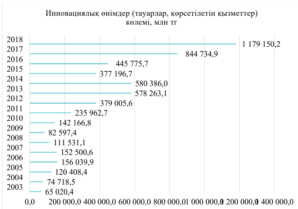
Сурет 1. Инновациялық өнімдер (тауарлар, көрсетілетін қызметтер) көлемі, млн тг. [5] дереккөз бойынша автормен құрастырылған

Көріп отырғанымыздай, өткен жылдарға қарағанда инновациялық өнімдердің көлемі артып, 2018 жылы бұл көрсеткіш 1 179 150,2 млн тг-ні құрап отыр. 2017 жылмен салыстырғанда бұл көрсеткіш 39,5 %-ға өскендігі байқалады. Яғни, инновациялық өнімдерді өндіру көлемі бойынша жыл сайын ілгерілеу байқалуда. Алайда, әлем елдерімен салыстырғанда бұл көрсеткіш анағұрлым аз. Себебі, инновациялық өнімдерді шығаруға деген сұраныс енді ғана өз арнасына түсіп, қолға алынуда, көптеген қаржы бөлініп, осы салаға деген қызығушылық артуда.