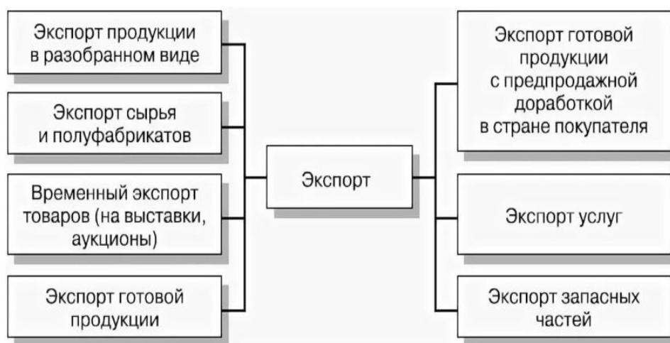
Рисунок 1. Основные формы экспорта

В иностранных государствах поддержка экспорта показана системой взаимодействующих друг с другом государственных и негосударственных институтов, включая профильные министерства и ведомства, финансовые структуры, региональные и зарубежные аппараты.