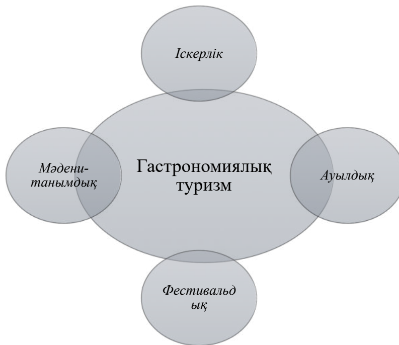
Сурет 1. Гастрономиялық туризм түрлерінің жіктелуі

Алайда, басқа ғалымдардың көпшілігі, мысалы, Т. Б. Климова, Е. Д. Буценко және басқалары сәл басқа классификацияны ұстанады (сурет 2). Олар тек қалалық және ауылдық гастрономиялық туризмнің түрлерін ғана көрсетеді. Қалғандардан айырмашылығы, бұл бөлімше жалпы сипатқа ие. Тарихи және мәдени-танымдық түрге келетін болсақ, осы жіктеменің жақтастары оларды бөліп көрсетпейді, ал гастрономиялық туризмнің қалалық немесе ауылдық түрлерінің құрамдас бөлігі деп санайды [2]: