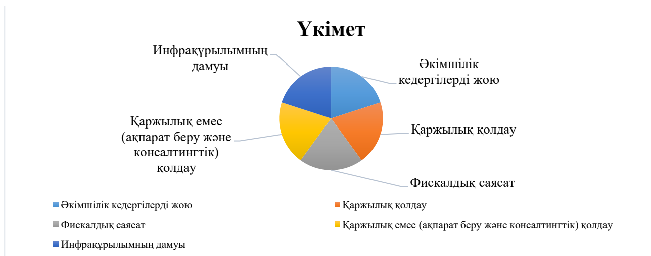
Сурет 2. Қазақстанда кәсіпкерлікті мемлекеттік қолдау жүйесі Ескерту –[4] әдебиет негізінде автормен құрастырылды

- кәсіп бастаған иелеріне салық салу процесс жүйесін саналы мониторинг әзірлеу.