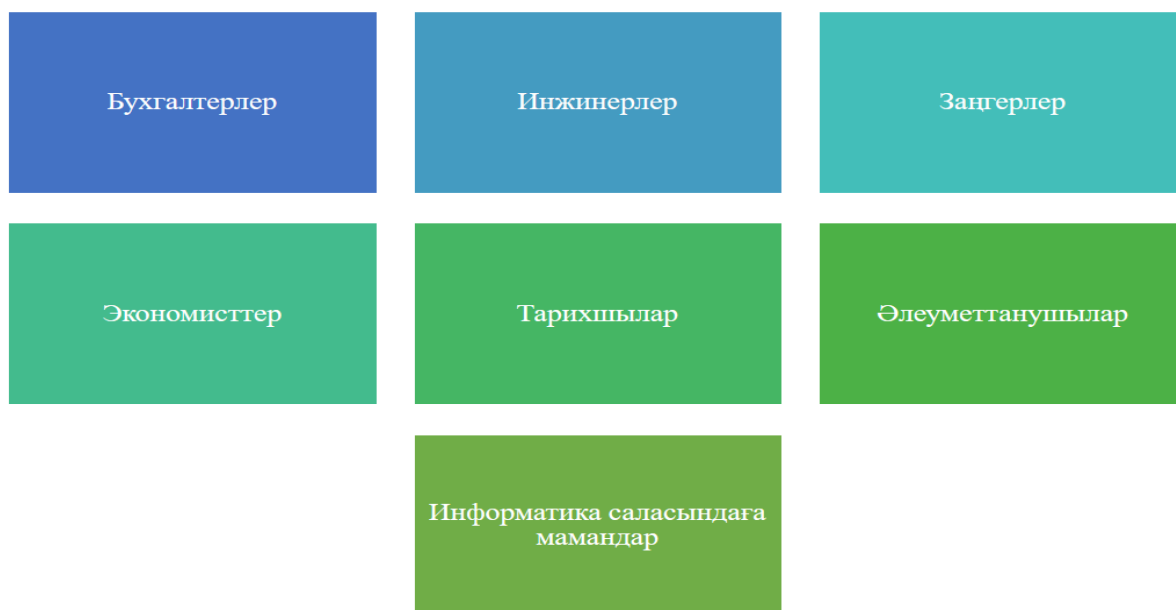
Сурет-2. Канаданың Аудиторлық Кеңесінің қызметкерлері жұмыс істейтін салалар.

Аудиторлық Кеңесінің қызметкерлері әртүрлі мамандықтар бойынша 600-ден астам қызметкерден тұрады. Аталған қызметкерлердің жұмыс істеу салалары 2-суретте көрініс тапқан.