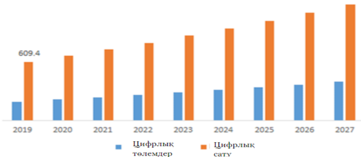
Сурет 3 – 2019-2027 жж. Цифрлық банкинг нарығындағы жағдайы мен 2027 жылға дейін цифрлық төлемдердің өсу болжамы

Цифрлық төлемдер алдағы уақытта жоғары инвестициялық мүмкіндіктерге ие болады: