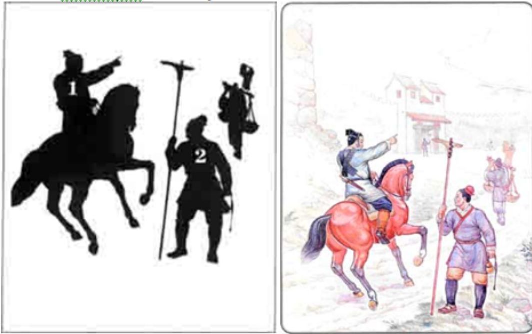
1-сурет. Ұлы қытай қабырғасының күзет мұнарасының гарнизоны