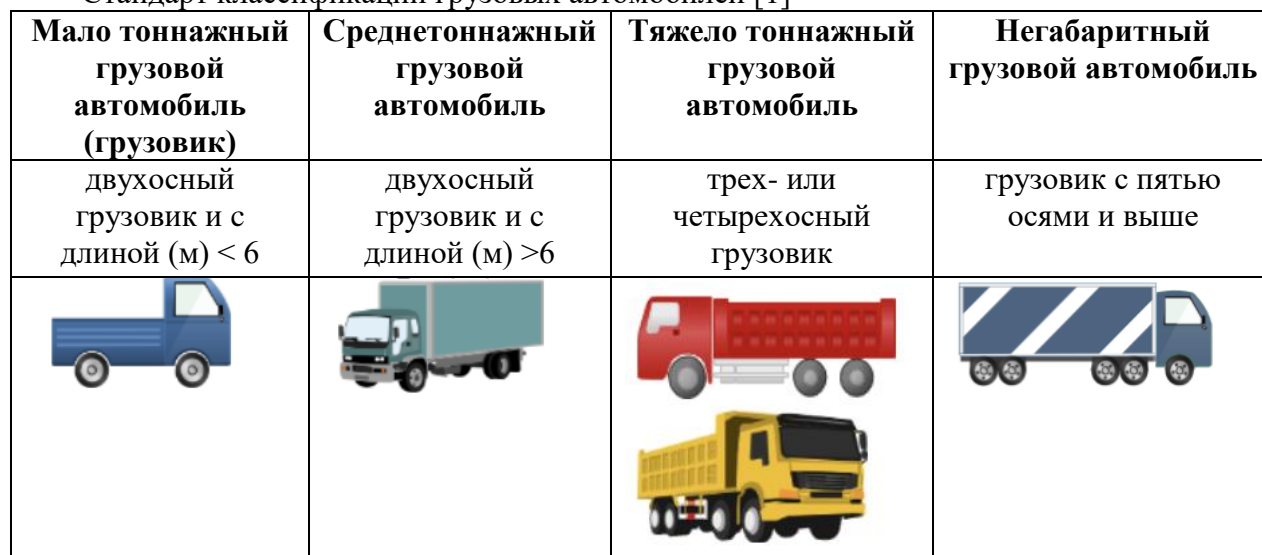
Стандарт классификации грузовых автомобилей [1]

Также грузовые автомобили более обширно классифицируются следующим образом (рисунок 1):