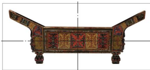
Сурет 1 – «Симметриялы бір осьті композиция» жиһаздың композициялық мәнерлілігін күшейту үшін осьтерді қолдану

Бұл ретте бір жарты бөлік айнадай екінші бөлігімен ұқсас. Симметриялы композицияның айқын әсерлі орталығымен ерекшеленеді. Орталық айқын ою-өрнекпен тепе-теңдікті бұзбайды. Оюдың қайталануынан, ырғақ пайда болды. Жиһаз нысанында түс пайдалану аркасында негізгі композициялық мәнерлігін айқындатады.