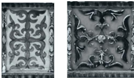
Сурет 4 – Рельефті көлемді-фронталды орындалған ою өрнек

Рельеф жазықтықта біріктірілген, алдыңғы бетте көлемдік-фронталь композицияда орындалған. Жиһазда көлемді-фронталдық композиция негізгі қасбет бөлігінде қолданылған (Сурет 4).