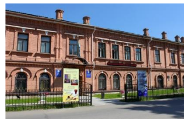
Рис. 4 Дом – музей Достоевского. Рис. 5 Восточно-Казахстанский областной музей. Рис. 6 Историко-культурный комплекс Абая "Жидебай-Борили.

Главной функцией гостиничных предприятий является предоставление временного жилья туристам. Гостиничные объекты различаются между собой: по вместимости, по продолжительности пребывания и по характеру туристической деятельности. Классификация гостиниц: