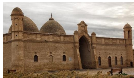
Рис. 1 Мавзолей Алаша-хана. Рис. 2 Мавзолей Карахана. Рис. 3 Мавзолей Арыстанбаба.