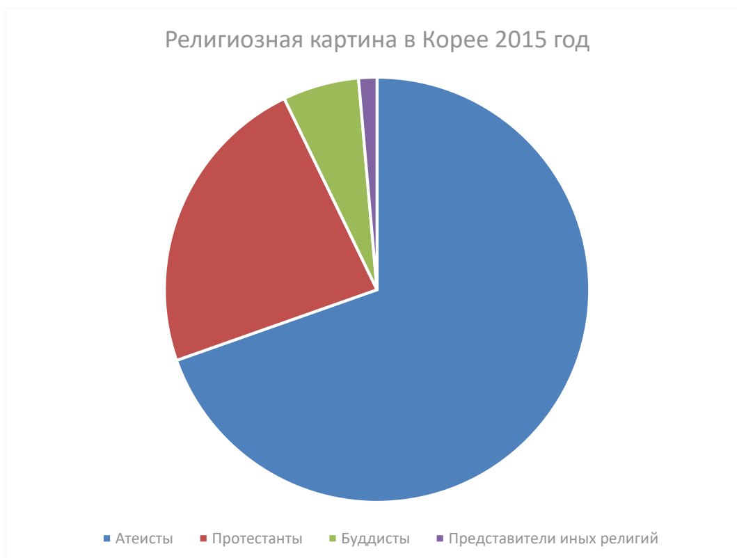
Диаграмма 1 - Религиозная картина в Корее (2015 год)

По данным, высказанным профессором SoonilHwang, профессора университета Донгук во время лекции в 2015 году, религиозная картина в стране выглядит следующим образом, вы можете увидеть в диаграмме 1.