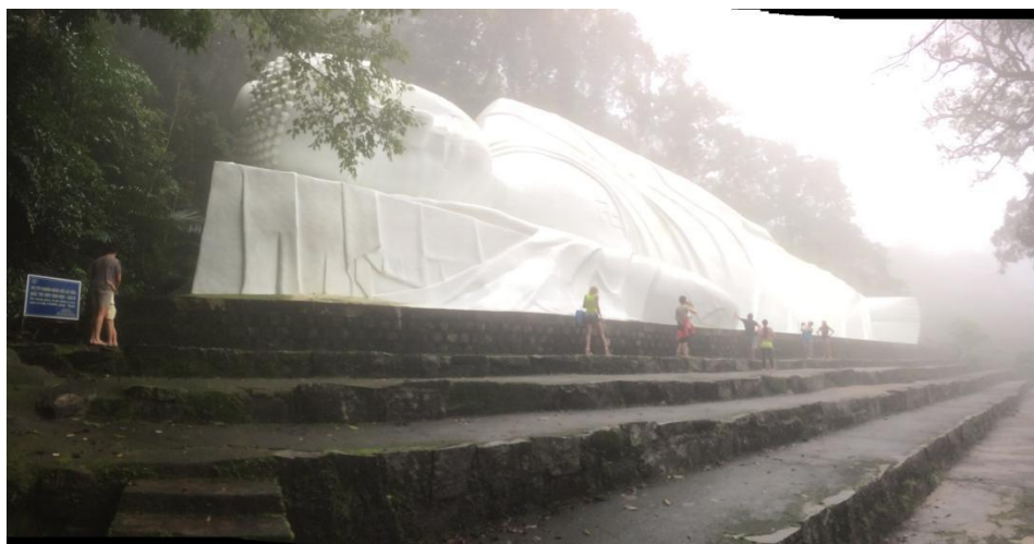
Рисунок 1 - Лежащий Будда на горе Таку

В последующем в XVIII столетии Буддизм стал восстанавливать свои позиции на территории Северного Вьетнама, стала возрождаться школа Чук Ламы. При этом данное религиозное течение стало своего рода антагонистом по отношению к деятельности администрации колонизаторов стран Западной Европы в общем и Республики Франция, в частности. «При этом данное положение продлевалось до середины XX столетия и становления социализма на территории Вьетнама. За данный промежуток времени прошли падение колониализма, влияние Японских милитаристов, война с США и многие другие исторические события повлиявшие на развитие страны» [2, с.9].