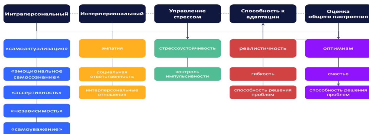
Рисунок 2 Адаптация модели Бар-Он по EQ-i

Изучение процесса разработки тестов, их надежности и валидности для каждого из этих инструментов оценки EQ напоминает нам о том, насколько сложно создать хороший психометрический инструмент. Бар-Он использовал строго научный подход к созданию своего инструмента, что отражено в подтверждающих исследованиях, цитируемых в его руководстве. Первоначальный EQ-i был опубликован в 1997 году. Его версия, EQ-i 2.0, была опубликована в 2011 году. Пересмотренный EQ-i можно использовать как инструмент самоотчета или как полную оценку 360°. Эти инструменты измеряют 15 навыков EQ, разделенных на пять составных частей, плюс показатель благополучия, который не влияет на общий балл EQ. Навыки и их сочетания перечислены выше в описании пересмотренной модели.