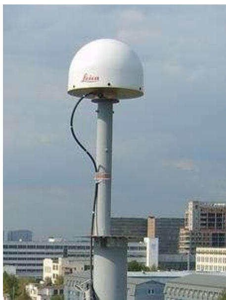
Рис.2. Базовая референцная станция

— «опорный (исходный) геодезический пункт», который предназначен для обеспечения выполнения измерений, а также для установления пространственного местоположения того или иного объекта (рис.2).