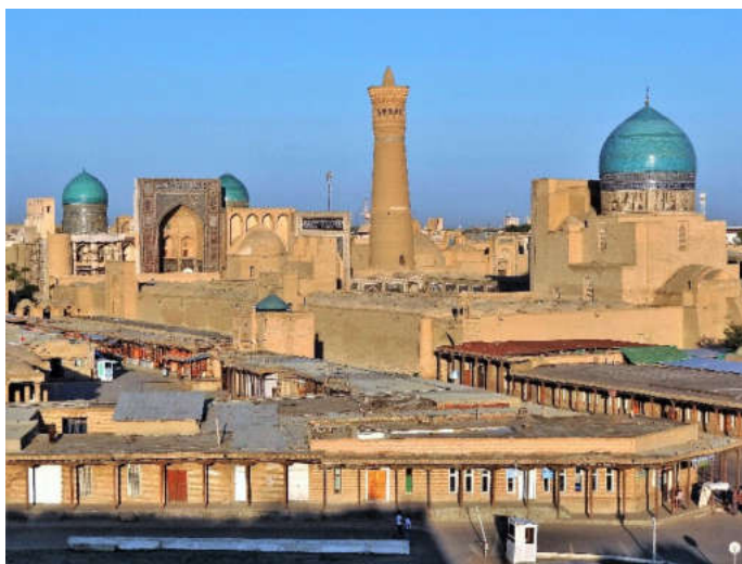
Рисунок 2. Город Бухара.

Основная часть. Бухара (узб. Вихого, Бухоро) – один из древнейших городов Центральной Азии, областной центр Бухарской области Республики Узбекистан. Культурный слой на территории города составляет более 20 м: на такой глубине археологи обнаружили остатки жилых и общественных зданий, посуду и монеты, орудия труда и ювелирные изделия, датируемые IV веком до н.э. [2] (Рисунок 2).