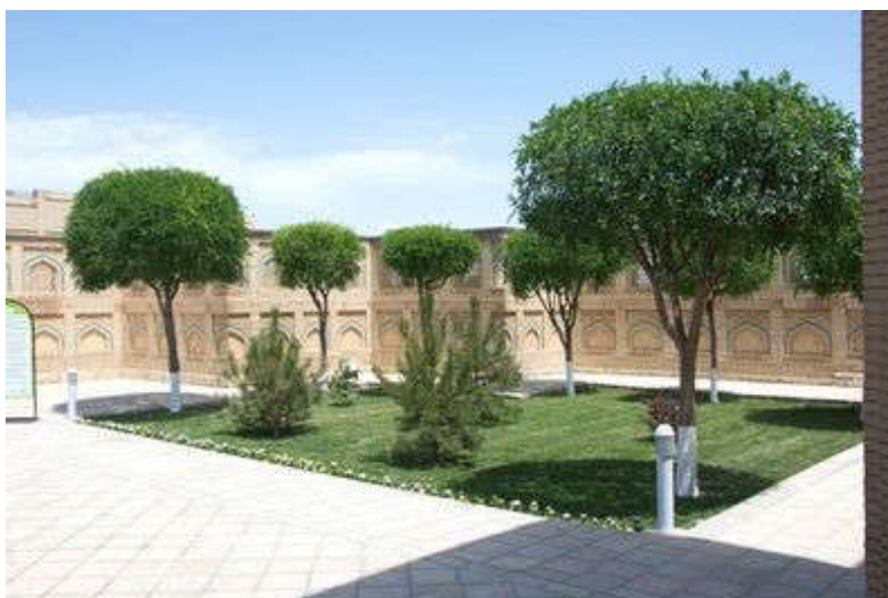
Рисунок 9. Небольшой садик