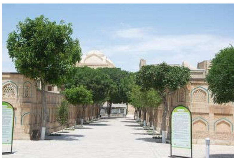
Рисунок 10. главный проход

Результаты. Сегодня мемориальный комплекс Баха ад-Дина Накшбанди является одной из крупнейших святынь не только в Узбекистане, но и в Центральной Азии. Архитектурное строение комплекса уникально и безусловно заслуживает большого внимания.