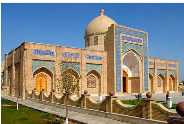
Рисунок 12. Основной вход