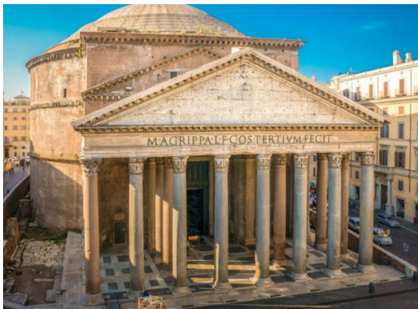
Илл. 1 Пантеон, г. Рим

Для анализа тектоничности сооружений выбрано пять примеров в виде значимых архитектурных строений: Пантеон, г. Рим; Венская государственная опера г. Вена; Эйфелева башня г. Париж; Хрустальный дворец г. Лондон; Музей наук имени принца Фелипе, г. Валенсия.