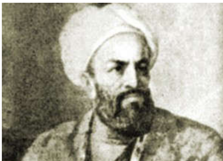
Рисунок 4. Баха' ад-Дин Мухаммад ал-Бухари

Суфийский орден Накшбанди. Начиная с XV в. братство Накшбандия превратилось в одно из самых распространенных суфийских орденов в мире. Накшбанди не призывал своих приверженцев к отшельничеству, напротив, он обязывал их быть усердными земледельцами, ремесленниками, торговцами, занимать государственные должности. Орден мирно уживался с официальным исламом. При Тимуридах орден оказывал большое влияние как на правителей, так и на широкие народные массы. Членами этого братства были выдающийся персидский поэт Джами (1414-1492) и великий узбекский поэт Алишер Навои (1441-1501).