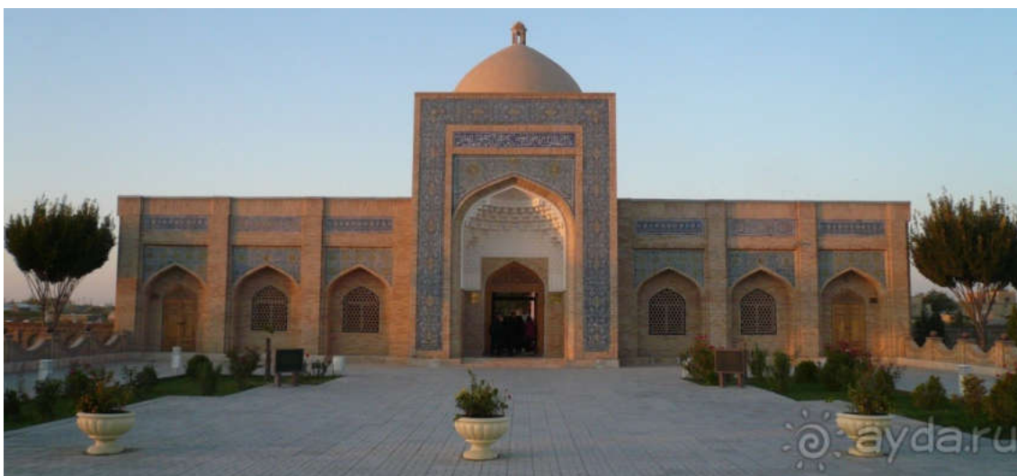
Рисунок 1. Главный фасад мемориального комплекса Баха ад-Дин Накшбанди.

Основная часть. Бухара (узб. Вихого, Бухоро) – один из древнейших городов Центральной Азии, областной центр Бухарской области Республики Узбекистан. Культурный слой на территории города составляет более 20 м: на такой глубине археологи обнаружили остатки жилых и общественных зданий, посуду и монеты, орудия труда и ювелирные изделия, датируемые IV веком до н.э. [2] (Рисунок 2).