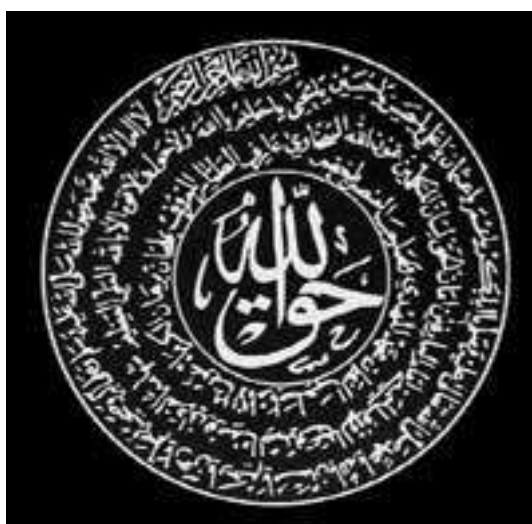
Рисунок 5. Символическая эмблема братства.

Накшбандия является тарикатом, придерживающимся вероубеждения о тихом зикре. Накшбандийский зикр, который суфии совершают вместе называется «Хатми хаджаган». Учение братства составили 11 морально-этических принципов, восемь из которых были унаследованы от суфийской школы Ходжагон, а три разработаны Накшбанди. [5] (Рисунок 5)