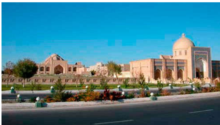
Рисунок 11. Общий вид