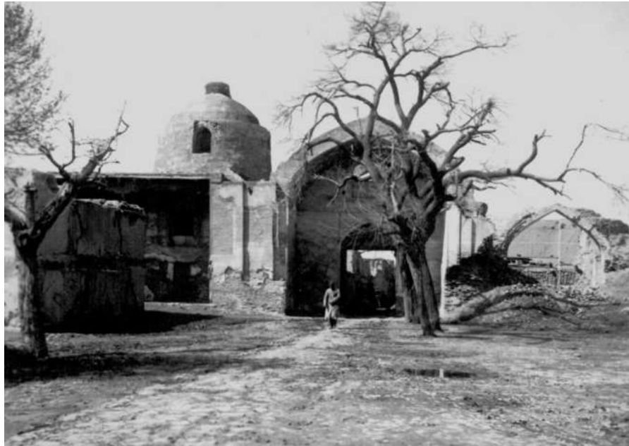
Рисунок 3. Вход на территорию мемориально-культурного ансамбля Баха ад-дин Накшбанд, 1937 г., вид со стороны некрополя.

Биография шейха Баха ад-Дина. Баха' ад-Дин Мухаммад ал-Бухари, получивший известность как Шах-и Накшбанд или Ходжа-йи бузург, родился в 718/1318 г. в селении Каср-и хиндуван (Кушк-и хиндуван) в семье ремесленника-таджика.