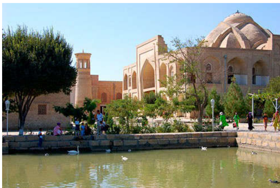
Рисунок 8. Хауз

Реконструкции. В 1993 году в честь 675-летия Бахауддина Накшбанда святыня была отреставрирована. В 2003 году были проделаны большие работы по благоустройству комплекса: построена дарвазахана (входное помещение) с высоким куполом, воссозданы богато декорированные айваны — террасы. Обширный сад соединил в единую композицию священное погребение Хазрата Бахауддина и место погребения его матери. Также был отреставрирован Дахмаи Шохон (Некрополь правителей), где покоятся останки некоторых правителей из династий Тимуридов, Шейбанидов, Аштарханидов и Мангытов.