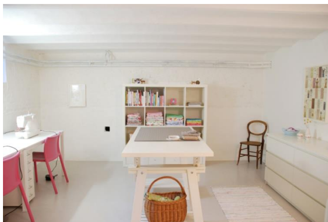
Сурет 1. Жұмыс аймағы

Жұмыс аймағы - тігін машинасымен, оверлокпен, тоқыма, қайшылар және тігіншіге қажетті басқа да заттар бар үстел. Бұл аумақты ең жарықтандырылған жерде, мысалы, терезе арқылы реттеу керек.