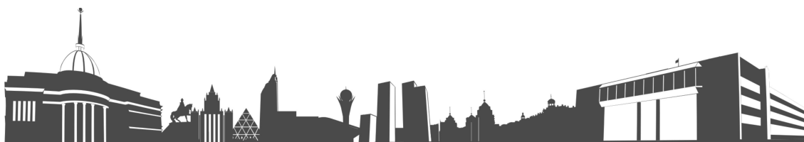
Рисунок 2 – Название рисунка