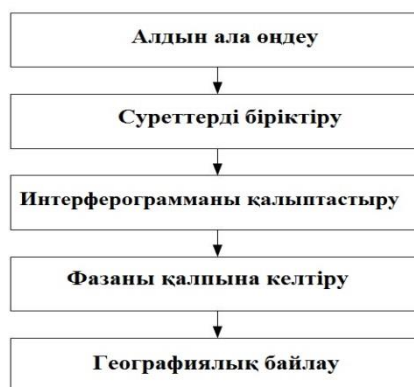
1 сурет. Интерферометриялық өңдеудің негізгі сатылары

Мамандырылған бағдармаларда өңдеу үшін бастапқы мәліметтер негізгі (master) және қосымша (slave) суреттерден тұратын интерферометриялық жұп болып есептелінеді. Интерферометриялық өңдеудің негізгі сатылары 1 суретте көрсетілген.