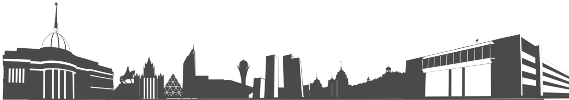
Рисунок 7 – Название рисунка