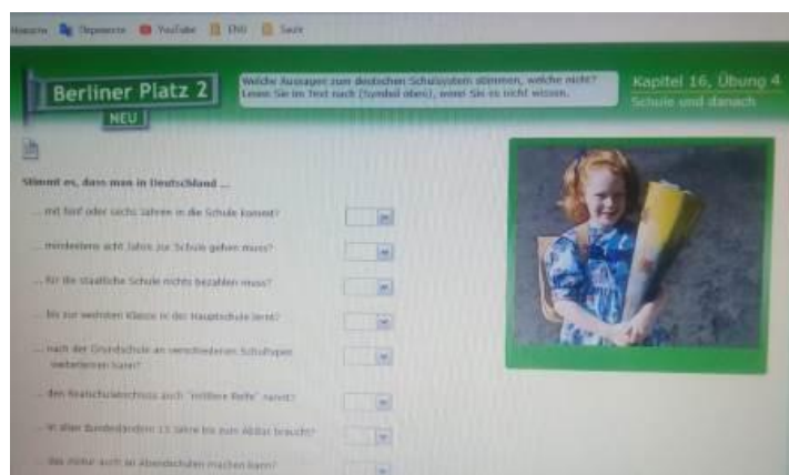
Рисунок 4: Задание 4

знак-ссылка на страноведческий текст о системе школьного образования в Германии, который был предложен в самом учебнике. То есть, обучающиеся имеют возможность восполнить пробел в своих знаниях, не возвращаясь к учебнику специально – к тексту можно обратиться тут же на платформе в онлайн-режиме, выполняя задание.