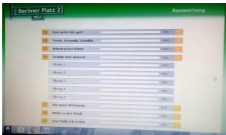
Рисунок 1: Тематическое меню

Тематическое меню учебника «BerlinerPlatz2» онлайн-упражнениями представлено на рисунке 1. В нем видно, что 16-й блок по теме «Schuleunddanach» представлен пятью интерактивными онлайн-упражнениями. Первое задание «Vier junge Leute sprechen über ihre Ausbildung und ihre Pläne. Lesen Sie die Fragen und hören Sie ihnen zu. Ordnen Sie dann die Namen zu» базируется на коротких аудио-текстах, цель задания – контроль навыков селективного аудирования. См. рисунок 2. Студенты прослушивают тексты в режиме онлайн и отмечают имя говорящего в предложенных ответах на вопросы.