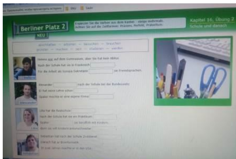
Рисунок 3: Задание 2

В следующем задании 3 контролируется знания об использовании предлогов: «In den Sätzen fehlen Präpositionen oder das Wort als . Ergänzen Sie die Texte.» Здесь также необходимо дополнить пропуски в коротких текстах соответствующими предлогами или словом als .