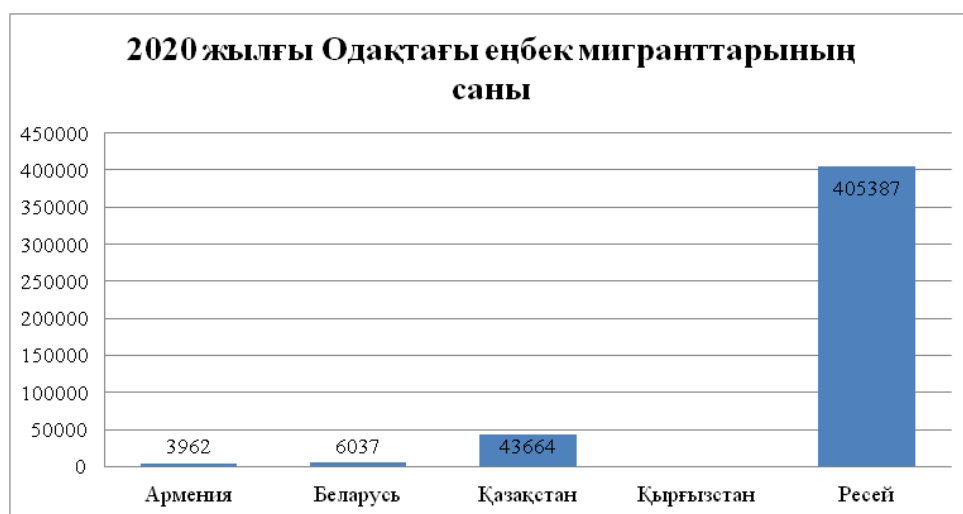
Сурет 4. Еуразиялық экономикалық комиссия мәліметі негізінде жасалды[7].

Одақ мемлекеттерінің азаматтары біліктіліктеріне сәйкес заңды түрде жұмыспен қамтылуға мүмкіндіктер қамтамасыз етілген. Ресей, Қазақстанға жұмысқа орналасқан Армения және Қырғызстан азаматтарының бәсекеге қабілеттілігі артқан. Еңбек мигранттары медициналық қызмет көрсету сияқты басқа да әлеуметтік жеңілдіктерін барған ел азаматтарымен тең дәрежеде алу мүмкіндігіне қол жетізуде. Сонымен қатар, ЕАЭО туралы шартта ортақ еңбек нарығын қалыптастырудың келесідей принциптері қарастырылған: