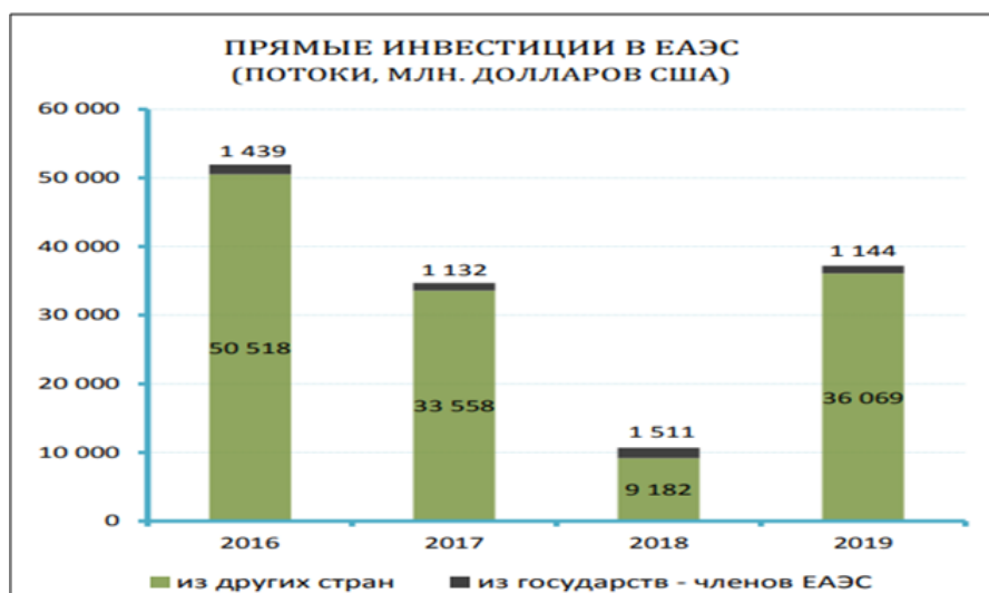
Сурет 3. ЕАЭО тікелей инвестиция көрсеткіші. Дереккөз[7].

артуы байқалады. 2021жылғы инвестицияға жағымды елдер рейтингінде Ресей 30-шы, Қазақстан 54-ші, Беларусь 73-ші, Армения 90-шы, Қырғызстан 98-ші орында, әсіресе Ресей, Қазақстан, Беларусь елдері бұрынғы рейтингпен салыстырғанда алға шыққан[9].