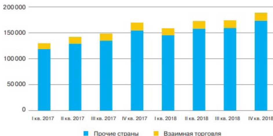
Рисунок 6. Объем внешней торговли России