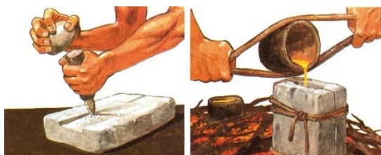
Рис. 2. Металлическое производство

несмотря на то, что колодцы находились практически в каждом жилище укрепленных поселений, вода в них не всегда была пригодна для питья. Существует несколько мнений о назначении колодцев: по имеющимся данным, они служили и для других бытовых нужд. Например, система «колодец-печь», по которой колодцы могли обеспечить прогрев печной полости. Колодец был пристроен к печи таким образом, что весь воздух из него поступал в печь и шел по кругу, а это, в свою очередь, способствовало равномерному прогреву всей печной полости. Это было нужно для металлического производства. Эта связь с металлургическими печами позволяет предположить, что каждая постройка непосредственно связана с металлургическим производством. Если эта связь имеет основания, мы можем сделать вывод о характере синташтинских поселений и их металлургической направленности, но многие исследователи с этой версией не согласны.