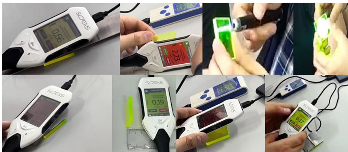
Рисунок 2 – Результаты измерений, полученные в ходе эксперимента

Таблица 1 – Контроль и распределение студентов экспериментальной группы по уровню сформированности навыков проведения физических экспериментов в ходе проведения опытно-педагогического эксперимента