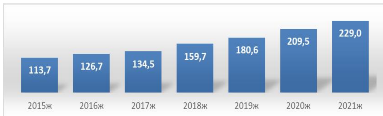
Сурет 2. Қазақстандық моноқалалардағы халқының орташа жалақы мөлшерінің өзгерісі, 2015-2021 жж.

Қазақстандық моноқалаларының дамуына әсер етуші тағы бір фактор ол жалақы мөлшері. Моноқала халқының әл ауқаты, өмір сүру сапасы мен өмір сүру деңгейінің жоғары болуы тікелей атқарған жұмысының жалақысына байланысты. Жалпы жұмыссыздық деңгейінің жоғары болуы, моноқалалардан халықтың жаппай кетуі, жалақының төмен деңгейі еңбек нарығында ұсыныстан еңбек сұранысының төмен болуына әкелуі мүмкін. Бұның бәрі моноқаланың әлеуметтік – экономикалық даму жағдайының нашарлауына әкеледі.