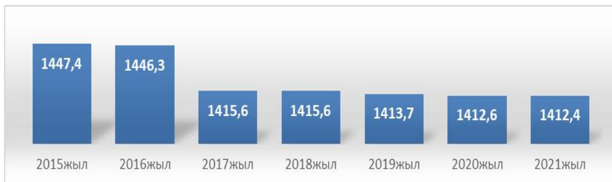
Сурет 1. Қазақстандық моноқалалардағы халқының жалпы санының өзгерісі, 2015-2021 жж.

Ескерту: [4] әдебиет негізінде автормен құрастырылған