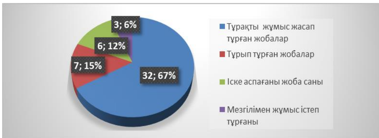
Сурет 4. Қазақстан моноқалаларында жүзеге асырылған жобалардың жағдайы Ескерту: [5] әдебиет негізінде автормен құрастырылған

Моноқалаларды қалай дамыта аламыз деген сұраққа ең алдымен экономиканы әртараптандырудың жолдарын іздестіру бірінші орынға қойылған болатын. Бірақта әртараптандыру арқылы моноқаланы дамыту іс шаралары жүргізілгенмен оларды дамыту шаралары баяу жүзеге асты. Осы тұста моноқалаларды дамыту үшін зәкірлік инвестициялық жобаларды жүзеге асыру қолға алынған. Моноқалалардың экономикасын әртараптандыру мақсатында 2013 жылдан бастап 2019 жылға дейін облыс әкімдерінің деректері бойынша 48 жоба іске асырылды және 13 жоба іске асырылу сатысында. Келесі суретте моноқалалардағы зәкірлік жобалардың жағдайы көрсетілген.