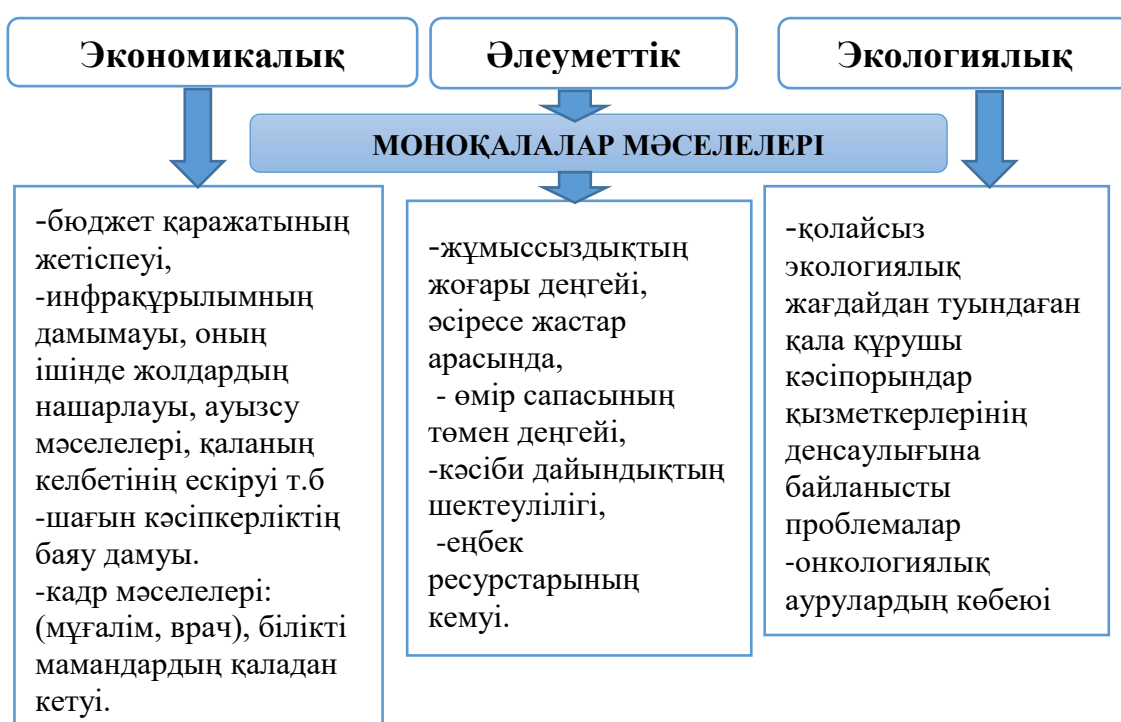
Сурет 5. Қазақстандық моноқалаларының өзекті мәселелері Ескерту: автормен құрастырылған

Қазақстандық моноқалалардағы мәселелерді үш негізгі топқа бөлуге болады: экономикалық, әлеуметтік, экологиялық.