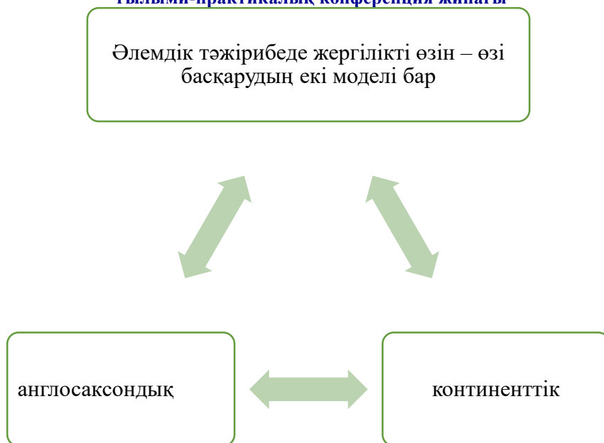
Сурет 1 Қазіргі уақыттағы жергілікті өзін өзі басқарудың модельдерінің түрлері