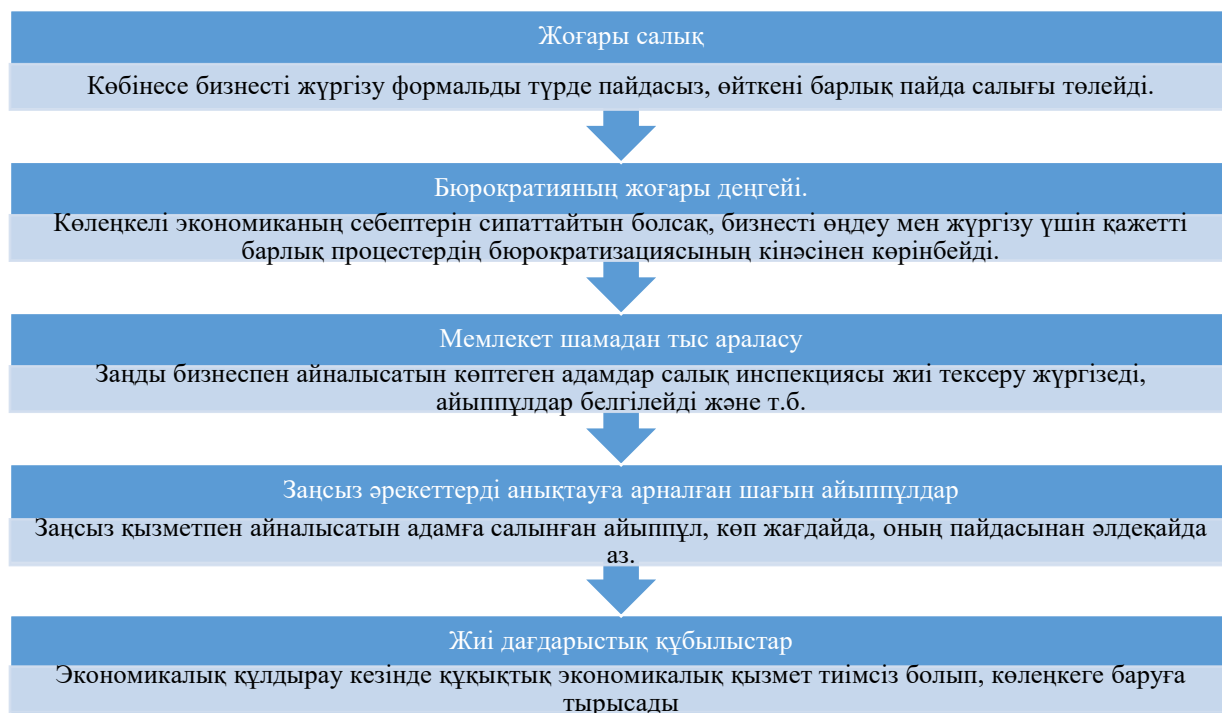
Сурет 4. Заңсыз әрекеттердің пайда болуын тудыратын негізгі факторлары.

Көлеңкелі экономика-қазіргі таңдағы өзекті, көзге көрінбейтін экономиканың бір саласы болып табылады. Қанша жерден көлеңкелі болғанымен экономикада өзіндік орнын бар. Кеше де, бүгін де болған бұл заң бұзушылықтар әлі де орын алуда. Және көп жағдайда ол өз көлеңкелігін сақтап қалады. Заңсыздықтарды анықтау, жазалау және алдын алу шаралары жүргізілуі тиіс. Осы орайда, мәселені шешу мақсатындағы менің басты ұсынысым – квазимемлекеттік секторлардан бөлек, жалпыға бірдей аудитті енгізу, аудит жүргізудің негізгі қағидаларын сақтай отырып, қоғамда аудитке деген жауапкершілік түсінігін қалыптасытыру.