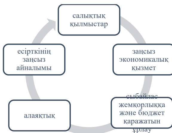
Сурет 2. Қылмыстық жолмен алынған кірістерді заңдастыру бағыттары

Көлеңкелі экономикаға қарсы күресте Қаржылық мониторинг агенттігі жүргізген іс-шаралар аясында келесідей заң бұзушылықтар анықталынды. Атап айтқанда, Астана қаласы бойынша Экономикалық тергеп-тексеру департаменті жалған бухгалтерлік құжаттарды жазып беру фактісі бойынша «АйДи Строй 2030» ЖШС директорына қатысты қылмыстық істі анықтады. Тергеу барысында анықталғандай қызметкер 2017-2018 жылдар аралығында Серіктестіктің атынан түрлі компаниялармен жалған мәмілелер ресімдегені белгілі болды. Нәтижесінде мемлекетке төленбеген салықтар түрінде 900 миллион теңгеден астам сомаға залал келтірілді. [3]