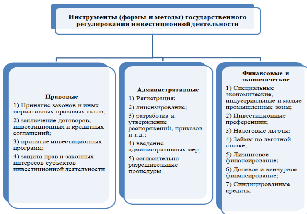
Рисунок 1 - инструменты государственного регулирования

На рисунке 1 представлены правовые, административные, финансовые и экономические инструменты государственного регулирования.