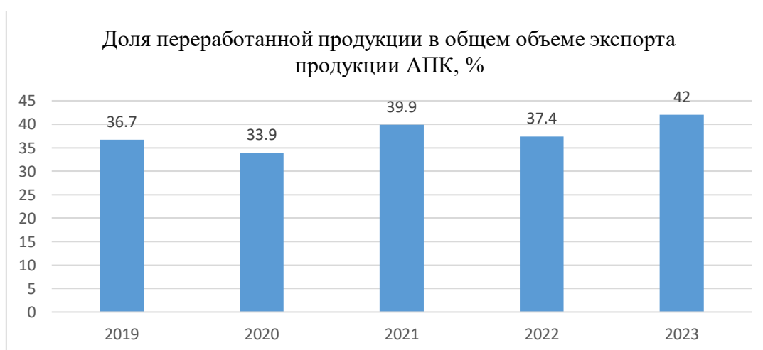
Рисунок 1 – Готовая продукция в общем объеме экспорта продукции АПК, %

В сельском хозяйстве длительное время преобладают личные подсобные хозяйства, которые из-за ограниченных финансовых ресурсов не могут освоить новые технологии, системы ирригации, современное оборудование и другие инновации, улучшающие урожайность и эффективность. Это препятствует повышению конкурентоспособности и эффективности отрасли. Большое количество мелких фермеров, не имеющих доступа к инновациям, приводит к тому, что рост производительности труда в сельском хозяйстве значительно отстает от других секторов экономики.