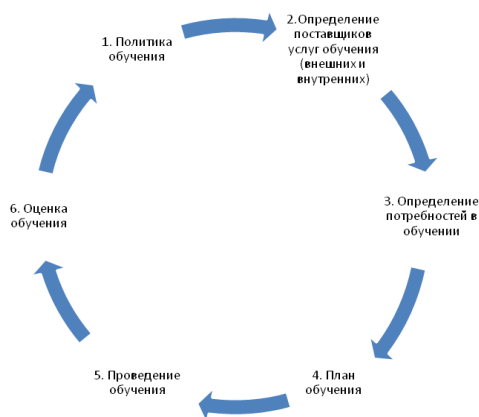
Сурет 1. Дж.Коулдың кадрларды даярлау жүйесіне көзқарас

Мұндай жүйелі көзқарас мыналарды анықтамайды: кадрларды басқарудың жалпы жүйесіндегі оқыту жүйесінің орнын, оқыту бюджетін анықтауды және ұйымның персоналын оқыту үдерісін заңды тіркеуді.