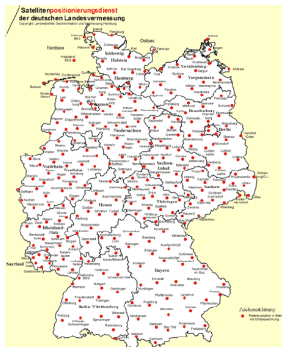
Рис.2 Станции немецкой сети активных референчных станций SAPOS

Создание геодезических сетей в Германии осуществляется при помощи специальных организаций, таких как Федеральное агентство по кадастру и геодезии (BKG) и Геодезический институт Фридриха Шиллера (IfAG) [3]. Эти организации занимаются разработкой и поддержкой геодезических сетей в Германии, а также обеспечивают доступ к данным о геодезических сетях для широкой общественности. Геодезические органы земель Федеративной Республики Германия (AdV) работают со спутниковой службой позиционирования SAPOS в рамках совместного проекта и таким образом обеспечивают актуальную, официальную пространственную привязку широкой территории для всех, используя современные технологии. Система основана на сети из примерно 270 референчных станций ГНСС, которые обслуживаются компанией AdV. Основой услуги SAPOS является сеть из примерно 270 опорных станций GNSS, постоянно работающих в федеральных землях, а также других опорных станций в соседних землях Федеративной Республики. Сеть состоит из более чем 250 станций с расстоянием между станциями от 30 до 50 км. Это гарантирует предоставление высокоточных и единообразных услуг данных по коррекции для всего штата в официальной трехмерной системе отсчета (ETRS89/DREF91).