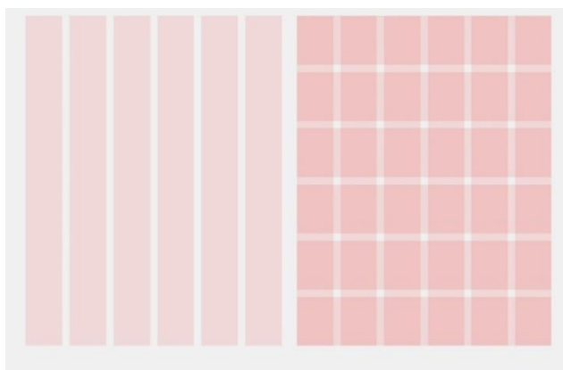
Сур. 3 Модульдік тор

Модульдік тор бұл сайтты жобалау құралы, ол сайт нысандарын тегіс сызыққа орналастыруға және көзбен жақсартуға көмектеседі. Сайт блоктардан тұрады, әр блокта мәтін, фотосурет мазмұны бар. Пайдаланушыға сайтты пайдалану ыңғайлы болуы үшін әр блокқа модульдік торды қолдануға керек болады. Модульдік тор сайтты үйлесімді етеді және ретке келтіреді, симметрияны сақтауға көмектеседі (Сурет 3). Модульдік тор сайттың негізі болып табылады сонымен қатар, тұтастығы үшін қажетті қаріпті таңдауға көмектеседі [9]. Сайтты пайдаланушыға қызықты ету үшін сайттың ақпараты мен дизайны маңызды. Модульдік тор сайтқа қызығушылық тудыруға көмектеседі, сондықтан сайттағы ақпарат есте сақтау оңай, ол дұрыс орналастырылуы және құрастырылуы керек. Композиция кез келген дизайндағы ең маңызды элемент және композиция дизайнды көрнекі түрде жақсартуға көмектеседі. Модульдік тор сайттың кез келген көлеміне қолданылады, егер сайтта көптеген ақпарат болса, модульдік тор дұрыс композиция жасауға көмектеседі, бұл сайттағы әр нысанды ұйымдастыруға көмектеседі.