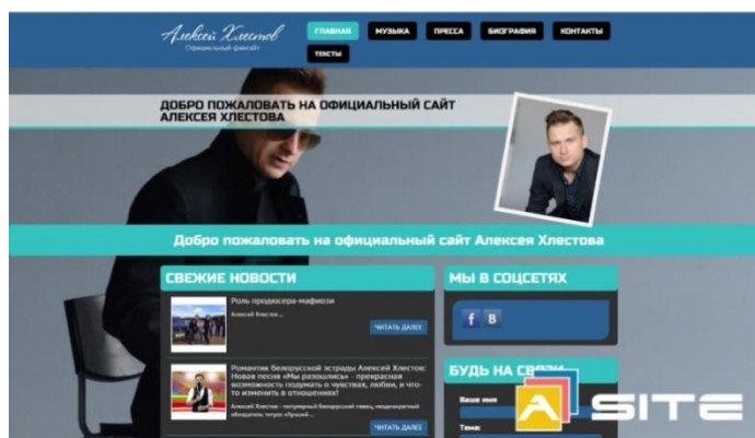
Сур. 1 концерт билеттері жайлы визитка сайты

Визитка сайты жарнама ретінде жұмыс істейді, компания мен тауарлар туралы ақпарат орналастырылған. Визитка веб сайттын пайдалану және жасау сайты болып саналады (Сурет 1). Бұл сайттың мақсаты компанияның қызметін қысқаша сипатталады. Міндетті ақпарат телефон нөмірі мен электрондық поштаны көрсету болып табылады. Визитка сайтының көптеген артықшылықтары бар. Егер сайттардың басқа түрлерімен салыстырар болсақ, онда визитка сайты барлық қызметтер үшін және барлық пайдаланушылар үшін ең қолайлы нұсқа болып табылады. Визитка сайты 3-4 күнде тез әзірленеді, өйткені оның ішінде аз ақпарат бар, бірақ сайттағы барлық ақпарат маңызды. Ең маңызды артықшылықтығы ыңғайлы пайдалану. Сайттағы барлық маңызды ақпарат, бір бетте пайдаланушылар уақытын жоғалтпайды, сайттағы әртүрлі белгішелерге өтпейді [2].