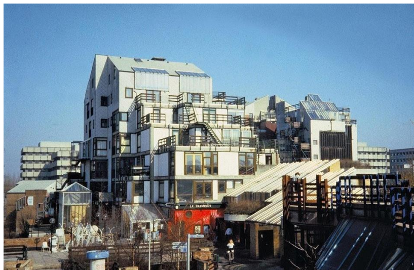
Рисунок 2. Комплекс общежитий университета в Лувене

При этом крайним выражением постмодернистских экспериментов по спонтанному использованию региональных знаков, популярных у потребителя (в данном случае студенческой молодежи из разных стран и регионов), в архитектуре стал комплекс общежития медицинского факультета университета в г. Лоувене (Бельгия), построенный по проекту архитектора Л. Кролля в 1974 году. Он представлял пространственную решетчатую структуру индивидуальные ячейки, которые формировались по концепции «лоскутного одеяла» с четко выраженными ритмическими и метрическими рядами (Рис. 2).