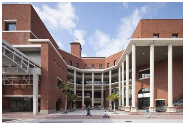
Рисунок 3. Железнодорожная станция университета Вакаяма

Но в архитектуре современной присутствует полярность направлений: традиционному направлению противостоит новаторское, но не только, в противовес традиционному лежит глобализация, которой в помощь функционирует интернет платформы для обмена опытом, как ArchDaile. Существование проработанных концепций прошлого, усиливает обмен опытом, знаниями, культурой среди профессионалов, приводя всех к некому общему стандарту.