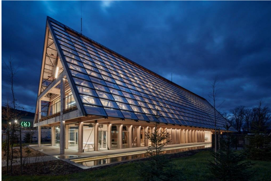
Рисунок 5. Штаб-квартира завода компании Kloboucká lesní в Чехии

Дальнейшей перспективой, по нашему мнению, станет параллельное существование двух тенденций, как усиление регионализма из-за возрождения культурного и исторического наследия, развития экономики, что вызовет спрос на архитектуру отличную от интернационального стиля из-за желания элит проявлять самоидентичность.