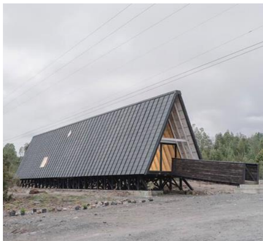
Рисунок 4. Частный жилой, построенный в Чили по проекту бюро Ivan Bravo Arquitectors

Сравнив 2 проекта: частный жилой, построенный в Чили по проекту бюро Ivan Bravo Arquitectors (Рис.4) и штаб-квартиру завода в Чехии (Рис.5), проект разработан бюро Mjolk architekt. Оба представлены архетипичной формой, то же дерево, тот же А-образный силуэт [3].