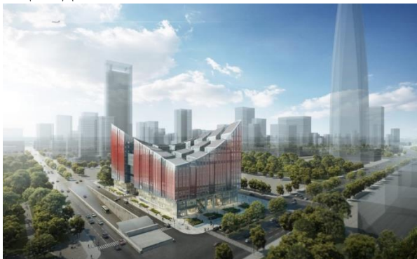
Сурет 1. «Ningbo Fashion Creative» сән шығармашылық орталығының рендерленген кескіні.

қолданылған. NFCC коммерциялық, тәжірибелік, көркем және болашақты ойлайтын қалалық өнеркәсіптік ғимаратты меңзейді.