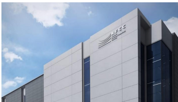
Сурет 2. Нинбо сән шығармашылық орталығының ғимарат формасындағы логотипі.

Имидждік ғимараттарды жобалауда, ғимарат формасын бренд таңбасы мен графикалық элементтер ретінде пайдалану немесе керісінше логотип формасын ғимарат архитектурасын жобалауда пайдалануға болады (Сур. 2).