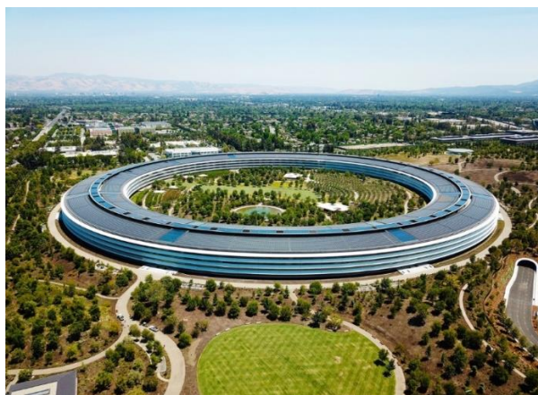
Сурет 3. Купертино, Калифорния, АҚШ: Apple штаб-пәтерінің аэрофотосуреті, Apple Park.

Бренд ғимараттарының имиджін қалыптастыруда қолданатын тағы бір әдіс - сәулеттік жарықтандыру. Ашық белгілерді де, жасырын белгілерді де қолдана отырып, өздерінің штаб-пәтеріндегі жарықтандыруды жанарту арқылы компаниялар брендті ұсынуға сәтті қол жеткізді. Брендті ерекшелеп көрсету ішкі жарықтандырудың дизайн стилімен үйлесетін жарқыраған қасбеттерді пайдалану арқылы қол жеткізіледі (Сур. 4). Мысалы, қанық түстер ойын орталықтарының ғимараттары үшін сәтті қолданылады, ал банктер немесе сән дизайнерлері, нәзік түстерді пайдаланады [6].