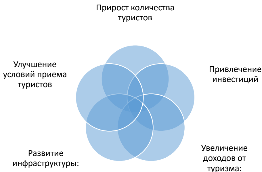
Рисунок 1. Оценка эффективности реализации государственной программы развития туризма в Казахстане

Оценка эффективности реализации государственной программы развития туризма в Казахстане на текущий момент может быть проведена на основе следующих показателей, показанных рисунком 1: