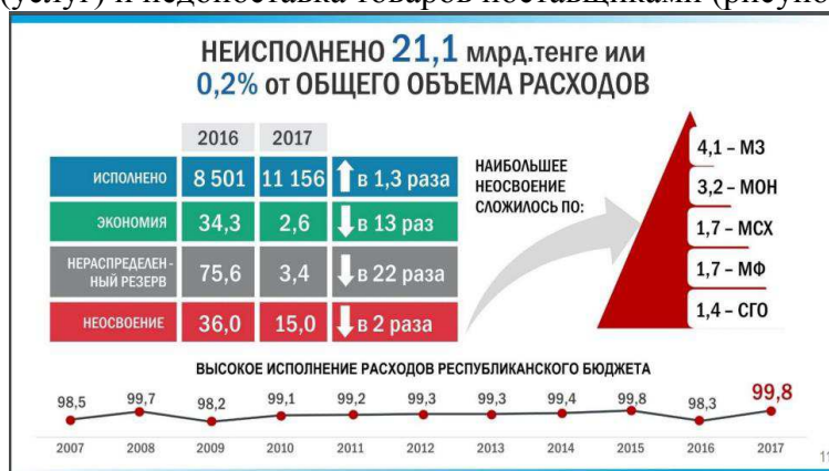
Рисунок 3 – Исполнение расходов по бюджетным программам

Как видно, 0,2% (21,1 млрд.тенге) бюджетных расходов остались не исполненными, из них 2,6 млрд.тенге - экономия, 3,4 млрд.тенге – нераспределенная сумма резерва. Но 15 млрд.тенге не были освоены. Ведущими причинами стали отставание от графика производства работ (услуг) и недопоставка товаров поставщиками (рисунок 3).