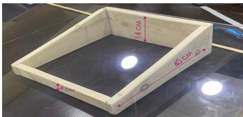
Рисунок 1. Первоначальный образец лабораторного стенда

Для конструирования первоначального образца лабораторного стенда были использованы подручные средства, такие как необработанные куски дерева, скрепленные между собой саморезами. Данный образец стенда изображен на рисунке 1.