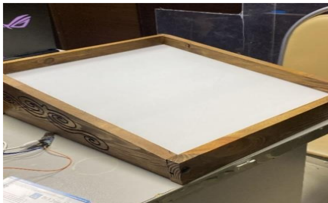
Рисунок 2. Итоговый вариант лабораторного стенда

В процессе сборки лабораторного стенда были выявлены существенные недостатки. Стенд был искривлен и не сохранял равновесие на ровной поверхности. Было решено заменить материал изготовления на более тонкие доски, похожие на те, что применяют при сборке мебельных изделий. Образец, собранный в процессе был также доработан. Были добавлены рисунки орнаментов по бокам и надпись взади, а также был нанесен слой лака для дерева. Итоговый вариант стенда представлен на рисунке 2.