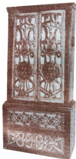
2 сурет: Асадал

«Асадал» негізінен қазіргі шкафтың қызметін атқарған. Этнографиялық деректерге қарағанда «Асадалдың» бірнеше түрі болған және асадалды туыс түркі халықтарының бәрі пайдаланған екен [2]. Белгілі этнограф Х.Арғынбаев өзінің еңбегінде «Асадалдың» ең көнесі қазіргі уақытта тумбочка тәрізденіп енінен биіктігі артық болып жасалса, екінші түрінің ені мен биіктігі шамалас келеді. Үшінші түрінің биіктігі кебежедей ғана болған. Ал төртінші түрі буфет тәрізденіп жасалған асадалдар деп жазады [3].