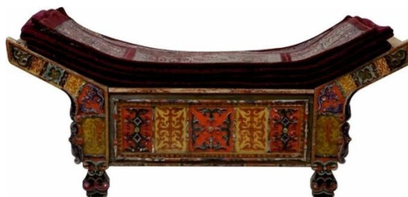
1 сурет: Ағаш төсек

Ағаш төсектерге жайылатын сәнді және оюланған төсек сырмақтар, құрақ көрпелер тұсына қойылатын адалбақан, ілінетін түскиіз, тоқылған кестеленген төсек жапқыш, керемет жарасып, үйдің сәні мен ажарын аша түсетін болған. Әдетте заттар екі қағида бойынша бағаланады: ыңғайлы - ыңғайсыз және көркем-көріксіз. Бірақ төсектің пішімі мен сол пішімге жабғыштар арқылы сән беріп тұрған көркі мен ыңғайлығына мін келтіре алмайсыз.