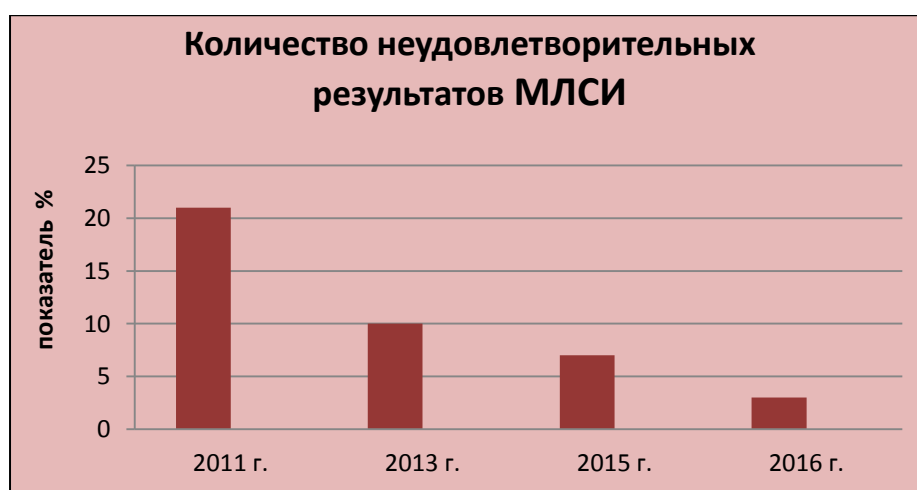
Рисунок 2 -Количество неудовлетворительных результатов МЛСИ/МЛС за 2011-2016гг.

Как мы видим, прослеживается четкая тенденция к снижению ошибочных результатов при проведении МЛСИ/МЛС в 2016 г. по сравнению с 2011 г, что говорит о повышении уровня качества лабораторных исследований и положительном опыте проводимой работы по организации МЛСИ/МЛС.