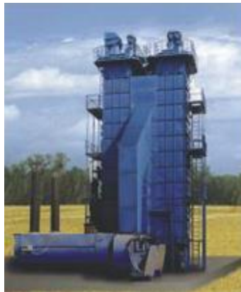
Рисунок 1- Шахтная зерносушилка

Немаловажным является простота очистки сушилки. Особенно это актуально для сушки разных партий семенного зерна. Процесс сушки оказывает влияние на качество зерна. Может ухудшиться всхожесть, произойти подгорание, снизиться хлебопекарные качества муки.