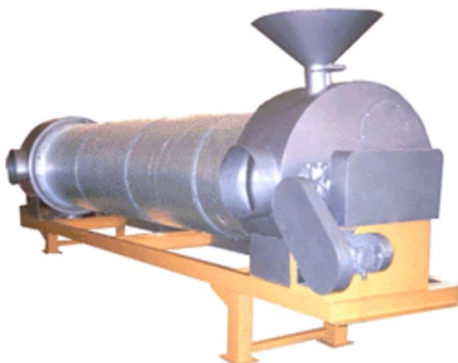
Рисунок 2 - Барабанная зерносушилка

Шахтные зерносушилки состоят из двух шахт, которые имеют равную вместимость и вертикальную норию. Обычно их монтируют на постоянном фундаменте. Принцип действия простой. Зерно под действием собственного веса проходит через сушилку. Подача горячего воздуха осуществляется снизу вверх. После сушки зерно подаётся в специальные охлаждающие камеры. Шахтные сушилки рассчитаны на партии в 8 и 16 тонн зерна. Для продовольственного и семенного зерна режимы сушки различны. Так при сушке продовольственного зерна за один цикл удаляется 5-6% влаги и производительность составляет 8-16 тонн/час, в то время как у семенного зерна удаляется 3-4% влаги при производительности 4-8 тонн/час. Для сушки зерна в шахтных сушилках необходима предварительная очистка от соломы и шелухи для предотвращения возгорания.