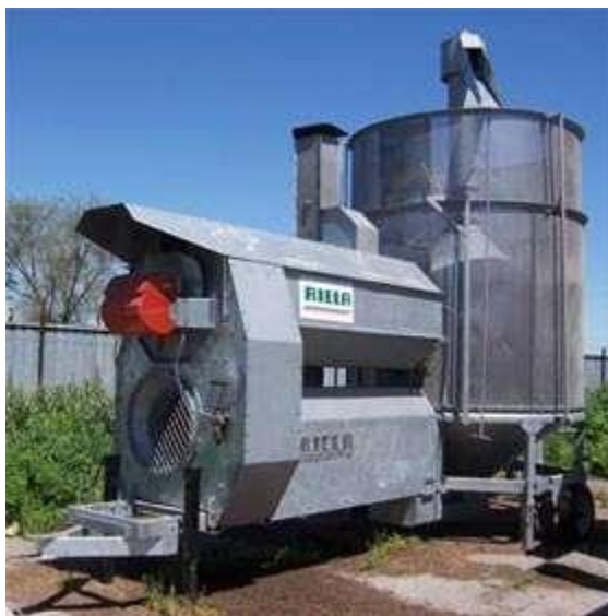
Рисунок 4 - Рециркуляционная зерносушилка

Камерные сушилки занимают значительную площадь. Подача зерна осуществляется механическим способом. У сушилок данного типа имеется воздуховод. Они состоят из двух камер с перфорированным полом. Зерно насыпается слоем, не превышающим 80 см. В противном случае зерно может плохо просушиться. Процесс сушки заключается в продувании зерна воздухом, который может быть немного подогрет. В сушилку загружается первый слой, затем после его высыхания второй. И так далее. До полного заполнения силоса зерном. Для наполнения силоса зерном и удаления слоя равной толщины существует специальное оборудование. Для равномерного удаления влаги в сушилке имеются встроенные шнеки для перемешивания зерна в процессе сушки. Влага удаляется за одну загрузку до сухого состояния зерна.