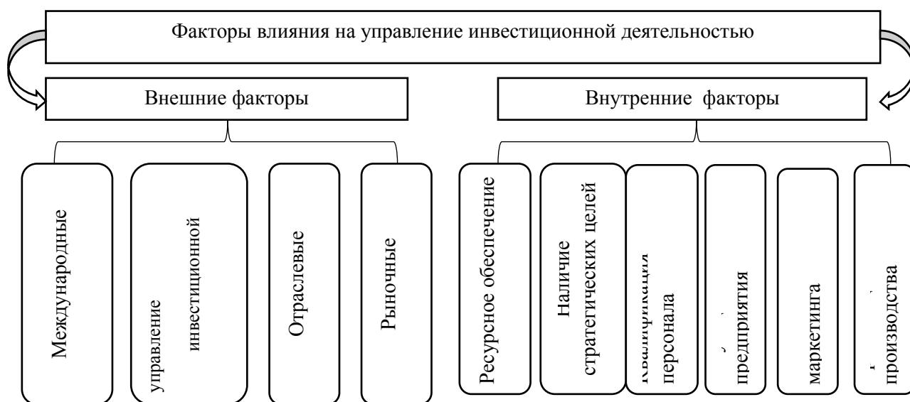
Рисунок 3. Систематизированные факторы, влияющие на управление инвестиционной деятельностью промышленных предприятий

международные факторы, факторы, связанные с государственным управлением инвестиционной деятельностью, отраслевые факторы, рыночные факторы (рисунок 3).