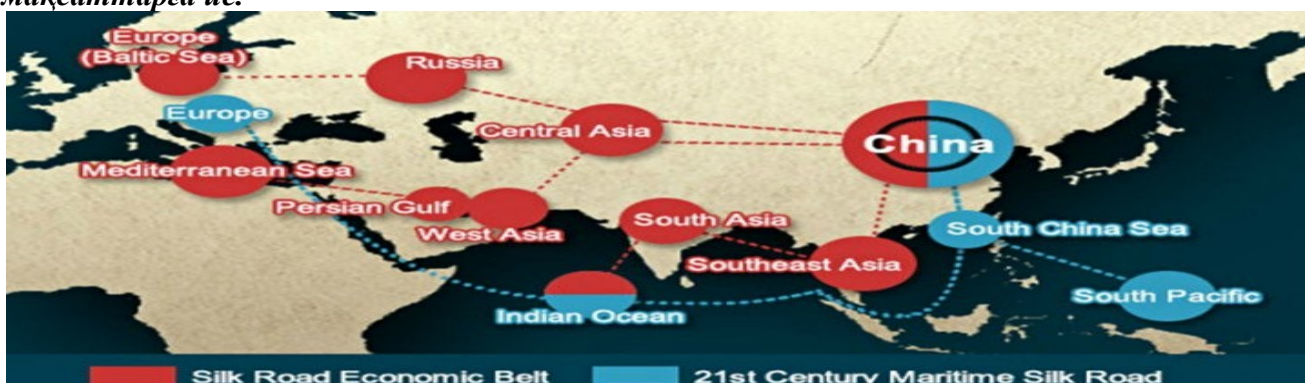
Сурет – 2 (2)

Қазақстан барлық үш жобаға қатысады, бірақ оған қатысуы түрлі деңгейлерге және мақсаттарға ие.