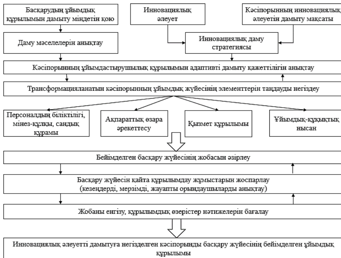
Сурет 3 Инновациялық әлеуетті дамытуға негізделген басқару жүйесінің моделі

бойынша қағидаттық шешімдер қабылдау, бағдарламаларды іске асыру барысын бағалауды іске асыратын штаб элементі болуы тиіс. Аталған мақсатта кәсіпорынның инновациялық әлеуетін дамытуға негізделген басқару жүйесінің моделі ұсынылады (сурет 3).