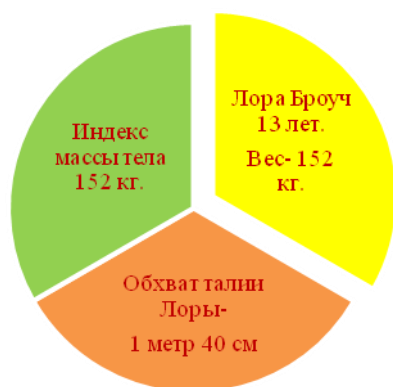
Рисунок №1 Характеристика избыточного веса тела Лоры Броуч

Последние полгода, Лора пыталась придерживаться диеты, но её любовь к еде не позволяла сбросить вес. Характеристику Лоры с избыточным весом, мы показываем в виде рисунка №1.