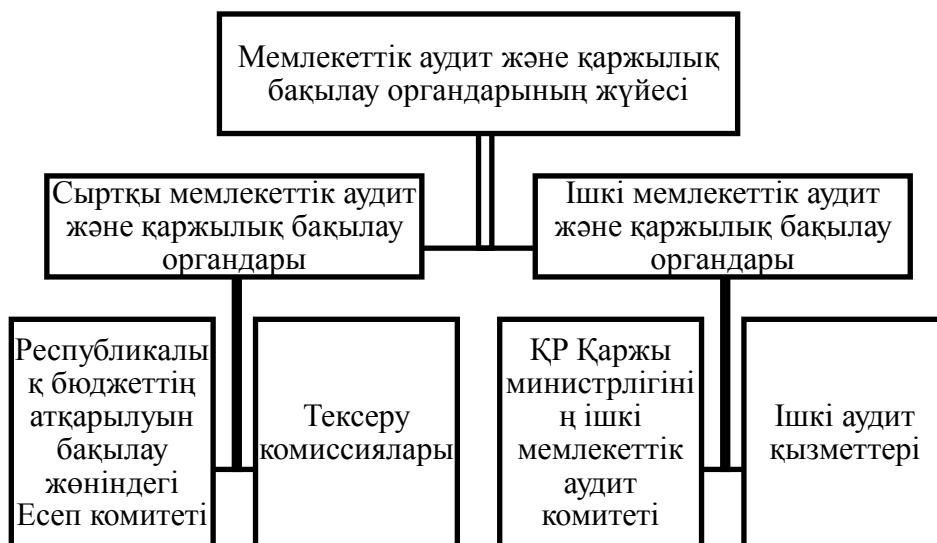
Сурет-1. Мемлекеттік аудит және қаржылық бақылау органдарының жүйесі [3]

Қазіргі таңда еліміздің нормативті-құқықтық құжаттарының талаптарына сәйкес қаржылық бақылау жүйесін кезең-кезеңмен реформалау нәтижесінде мемлекеттік аудит органдарының жаңа жүйесі қалыптасқан [1;2;3]. Жүйе ішкі және сыртқы мемлекеттік аудит органдарын қамтиды(Сурет-1).