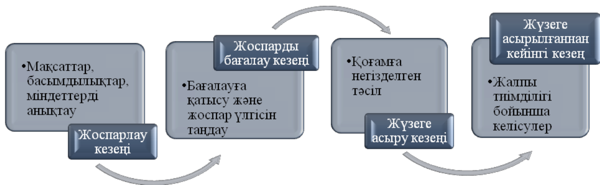
Сурет 1 – Мәліметтер негізінде авторлармен құрастырылған

Туризм саласын жоспарлауды жүзеге асыруды төрт топқа біріктіруге болады: жоспарлау кезеңі; жоспарды бағалау кезеңі; жүзеге асыру кезеңі; жүзеге асырылғаннан кейінгі кезең. Сонымен қатар, институционалдық жоспарлар 1 суретте көрсетілгендей, әр кезеңге қатыстырылу керек.