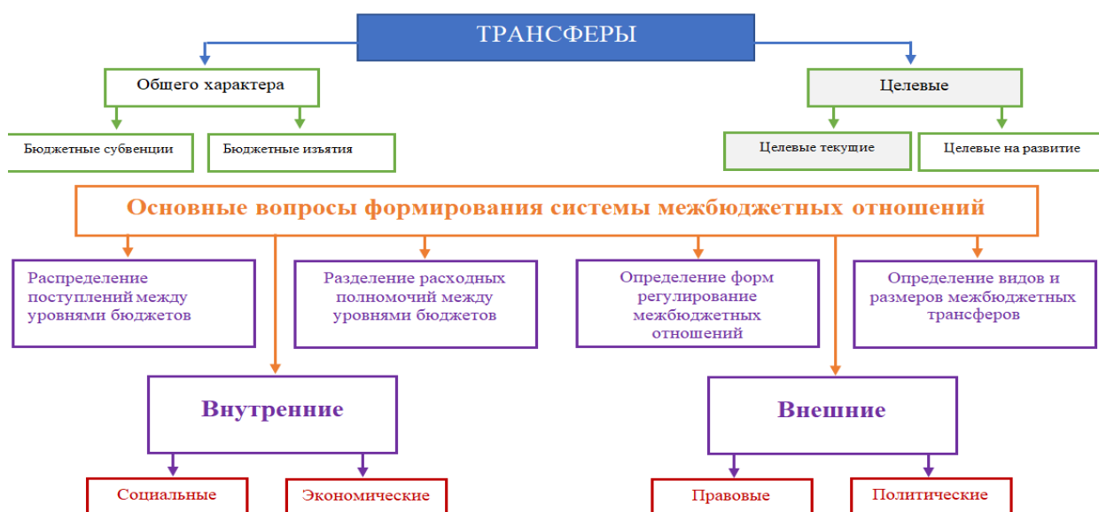
Рисунок 2– Система регулирования межбюджетных отношений через трансферты Примечание: составлено автором

Целевые трансферты и бюджетные кредиты используются местными исполнительными органами только в соответствии с их целевым назначением, определенным в соответствующих бюджетных программах, за исключением целевых текущих трансфертов, передаваемых в соответствии с Бюджетным Кодексом на компенсацию потерь, влекущих сокращение доходов местных бюджетов.